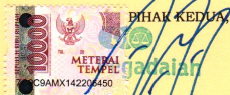
TOMY DJOKO TRI RAHARDJO KEPALA

Demikian Kesepakatan Bersama ini dibuat dan ditandatangani di Balikpapan pada hari dan tanggal tersebut di atas dalam rangkap 2 (dua) bermeterai cukup, masing-masing mempunyai kekuatan hukum yang sama.